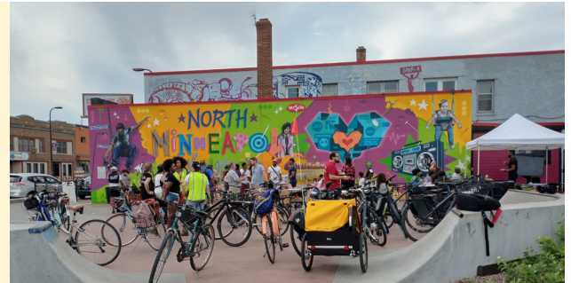
9 de octubre: Recorrido en bicicleta, a pie, en autobús por las opciones de ruta de Minneapolis y las áreas de estudio de las estaciones.